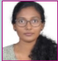
സുഹ്റമോൾ Z ഗവേഷക മലയാളവിഭാഗം കേരളസർവകലാശാല

കു ടുംബങ്ങൾ ഇമ്പമുള്ളതാണ് കുടുംബം. കുറച്ച് കാലങ്ങളായി കേരളീയ കുടുംബസങ്കല്പത്തെ നിർവചിക്കുന്ന വാക്യമാണിത്. 'കുടുംബം' എന്ന വാക്കിനെ രണ്ടായി വേർതിരിച്ചു നിർമ്മിച്ചെടുത്ത അർത്ഥം. സമൂഹത്തിന്റെ അടിസ്ഥാനങ്ങളിൽ ഒന്നായി വർത്തിക്കുന്ന കുടുംബം എന്ന സ്ഥാപനത്തിന്റെ പൊള്ളത്തരങ്ങളെ അഥവാ വ്യക്തിജീവിതത്തെ സാരമായി ബാധിക്കുന്ന ഈ സങ്കല്പത്തിന്റെ ദോഷവശങ്ങളെ മറച്ചുവെക്കുന്ന തരത്തിൽ പ്രസ്തുത നിർവചനം പ്രവർത്തിക്കുന്നുണ്ട്. സാമൂഹിക മനോഭാവം കുടുംബത്തെ മഹത്വവൽക്കരിക്കാൻ ഒരു വശത്ത് ശ്രമിക്കുമ്പോൾ മറുവശത്ത് വ്യക്തിജീവിതത്തിന്റെ വ്യതിരേകാത്മകതയും സ്വാതന്ത്ര്യവും മുൻനിർത്തി കുടുംബസങ്കല്പത്തെ മാറ്റി പണിയുന്നുണ്ട്. ഒരു നിശ്ചിതവ്യവസ്ഥിതിയിൽ നിന്ന് മാറി, പല പാളികളിലൂടെയുള്ള നോട്ടം സാധ്യമാക്കുന്ന വിധത്തിൽ, ഏതൊരു വ്യക്തിക്കും പാകപ്പെടുത്താവുന്ന വ്യവസ്ഥിതിയിലേക്ക് കുടുംബസങ്കല്പം ഇന്ന് സഞ്ചരിച്ചുകൊണ്ടിരിക്കുകയാണ്. നിലവിലുള്ള കുടുംബാസൂത്രണത്തിന്റെ മാതൃകയും പ്രതിനിധാനവും മാധ്യമങ്ങൾ പ്രദർശിപ്പിക്കുന്നുണ്ട്. ചലച്ചിത്രങ്ങൾ, സീരിയലുകൾ, കൊമേഡി ഷോകൾ, പരസ്യങ്ങൾ, യൂട്യൂബ് വീഡിയോകൾ തുടങ്ങിയവ കുടുംബവ്യവസ്ഥിതിയുടെ മൂല്യസങ്കല്പങ്ങളെ സംരക്ഷിക്കുന്നുണ്ട്, വ്യാഖ്യാനിക്കുന്നുണ്ട്, ചോദ്യം ചെയ്യുന്നുമുണ്ട്. മാധ്യമമെന്ന നിലയിൽ പരസ്യ