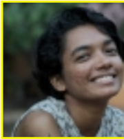
ആതിര നികത്തിൽ ഗവേഷക തിയേറ്റർ ആന്റ് പെർഫോമിങ്ങ് ആർട്സ് സ്കൂൾ ഓഫ് ഡ്രാമ, തൃശൂർ

എഴുപതുകളിൽ മുൻപ് ഉത്സവപ്പറമ്പുകളിൽ കളിച്ചു വിജയിച്ചിരുന്ന നാടകങ്ങൾ ഇത്തരത്തിൽ കുടുംബ ബന്ധങ്ങളെയും അതിനെ ചുറ്റിപറ്റിയുള്ള പ്ര