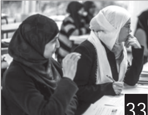
മുസ്ലിം സ്ത്രീകളുടെ അനന്ത രാവകാശം : ചില വായനകൾ - ദിൽഷാദ് ലില്ലി