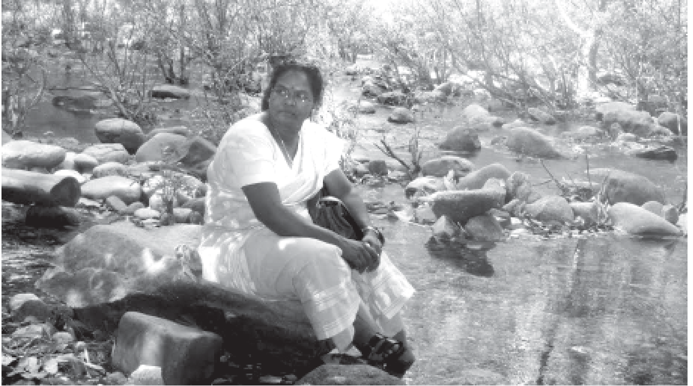
കവർസ്റ്റോറി / അഭിമുഖം