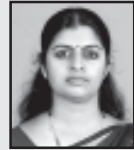
പരിഭാഷ : വിനീത മേക്കോത്ത്