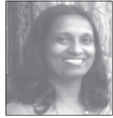
സതി അങ്കമാലി കവി