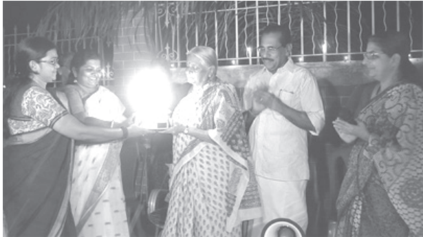
NWMI സുഗതകുമാരി ടീച്ചറെ ആദരിച്ചപ്പോൾ

പ്രശസ്ത എഴുത്തുകാരി സുഗതകുമാരിക്ക് സരസ്വതീ സമ്മാനം ലഭിച്ച വേളകളിൽ തിരുവനന്തപുരം ഘടകം മാനവീയം വീഥിയിൽ സുഗതകുമാരിയെ ആദരിച്ചു. 2013 ജൂൺ 5 രാത്രി എട്ട് മണിക്ക് മൺചെരതുകളുടെ വെളിച്ചത്തിലാണ് പരിപാടികൾ സംഘടിപ്പിച്ചത്. ഒരു സൗരോർജ്ജ വിളക്കാണ് സുഗതകുമാരിക്ക് സമ്മാനമായി നൽകിയത്. വിവിധ കോളേജുകളിലെ കുട്ടികൾ സുഗതകുമാരി ടീച്ചറിന്റെ കവിതകൾ ചൊല്ലി.