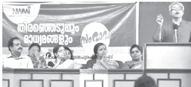
തെരഞ്ഞെടുപ്പും മാധ്യമങ്ങളും എന്ന സംവാദത്തിൽ നിന്ന്