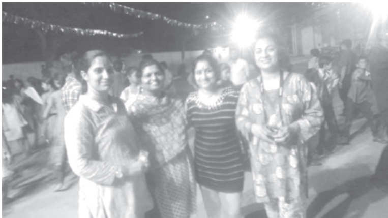
അഹമ്മദാബാദ് ദേശീയ സമ്മേളനം - കേരള പ്രതിനിധികൾ