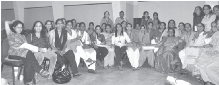
കോഴിക്കോട് ദേശീയ സമ്മേളനം കേരളത്തിൽ നിന്ന് പങ്കെടുത്തവർ

‘നെറ്റ്‌വർക്ക് ഓഫ് വിമൻ ഇൻ മീഡിയ ‘എന്ന വനിതാ മാധ്യമ നെറ്റ്‌വർക്ക് ഉണ്ടായത് 2002 ൽ ന്യൂഡെൽഹിയിൽ നടന്ന ഒരു ത്രിദിന ശില്പശാലയുടെ അനന്തരഫലമായാണ്. ‘ഇന്ത്യൻ വുമൺ ഇൻ ജേർണലിസം’ എന്ന വിഷയത്തെ അധികരിച്ച് ‘വോയിസസ്’ എന്ന ബാംഗ്ലൂർ അധിഷ്ഠിത എൻ ജി ഒ 2002ൽ സംഘടിപ്പിച്ച ശില്പശാല