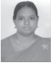
ധന്യ പി.ഡി. മലയാളം അദ്ധ്യാപിക ശ്രീ ശങ്കരാചാര്യ സംസ്കൃത കോളേജ്, കാലടി