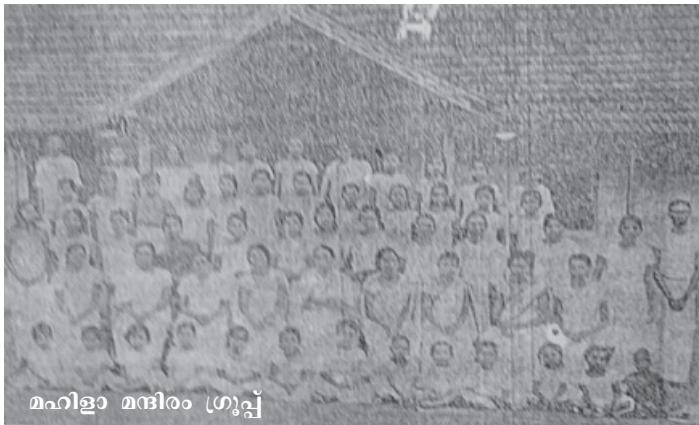
മഹിളാ മന്ദിരം ഗ്രൂപ്പ്

സ്ഥാപനവത്കൃത വിജ്ഞാനങ്ങളിൽ നിന്നും സാമൂഹികസ്ഥാപനങ്ങളിൽ നിന്നും ഒഴിവാക്കപ്പെട്ട കുടുംബബന്ധങ്ങളുടെ സ്വകാര്യമണ്ഡലത്തിൽ വിഹരിക്കുവാൻ നിർബന്ധിതയാകുന്ന സ്ത്രീ അതിൽ നിന്നും കുതരിമാറി സാമൂഹ്യമണ്ഡലത്തിലേക്ക് ചേക്കേറാൻ നടത്തിയ ശ്രമങ്ങളെ ചരിത്രം എന്നും അവഗണിക്കുകയാണുണ്ടായത്. അധികാര കേന്ദ്രങ്ങളിൽ നിന്നും സ്ത്രീകൾ പാർശ്വവത്ക്കരിക്കപ്പെട്ടത് അക്ഷന്തവ്യവും ന്യായത്തിനു നിരക്കാത്തതുമായി തിരിച്ചറിയപ്പെടുന്ന ആധുനികാനന്തര സന്ദർഭത്തിലാണ് സ്ത്രീപക്ഷ രാഷ്ട്രീയം അതിന്റെ അനന്തമായ സാധ്യതകളെ തുറന്നിടുന്നത്.