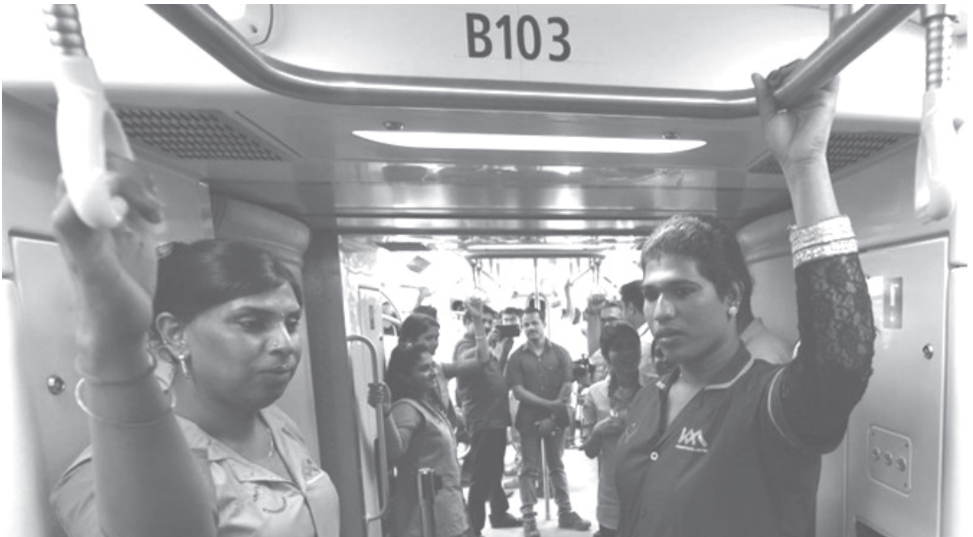
കൊച്ചി മെട്രോയിൽ ജോലി ചെയ്യുന്ന ട്രാൻസ്ജെൻഡേഴ്സ്

അതുപോലെ ട്രാൻസ്ജെൻഡർ ആയി മാറുന്നത് അവരുടെയോ നിങ്ങളുടെയോ തീരുമാനമല്ല. ജോലിസ്ഥലത്തും പൊതുഗതാഗതം ഉപയോഗിക്കുന്നിടത്തും ചടങ്ങുകളിലും എന്നുവേണ്ട സകലയിടത്തും ഇവർക്ക് വിവേചനം അനുഭവിക്കേണ്ടിവരുന്നു. അവർ പെണ്ണാകുന്നതോ ആണാകുന്നതോ അനാശാസ്യത്തിനു വേണ്ടി