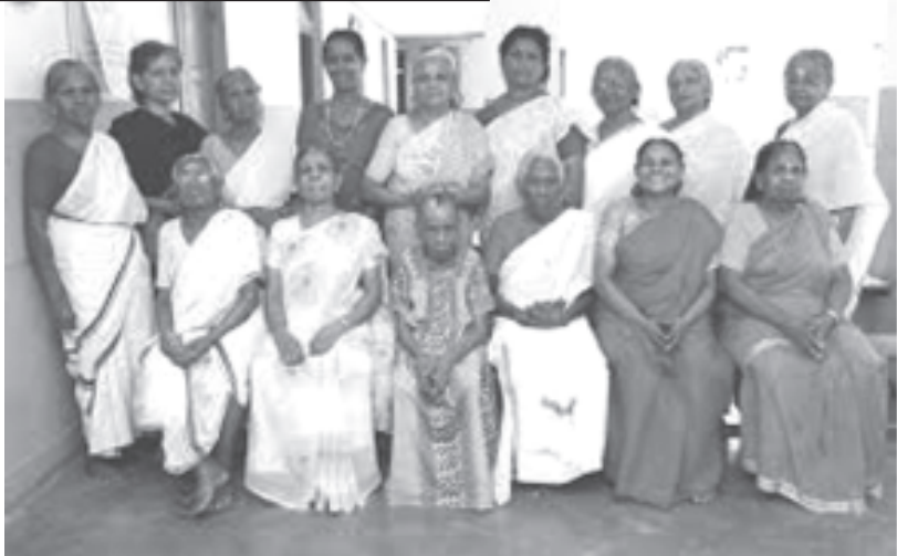
ശ്രീനാരായണ സേവികാ സമാജം അന്തേവാസികൾ