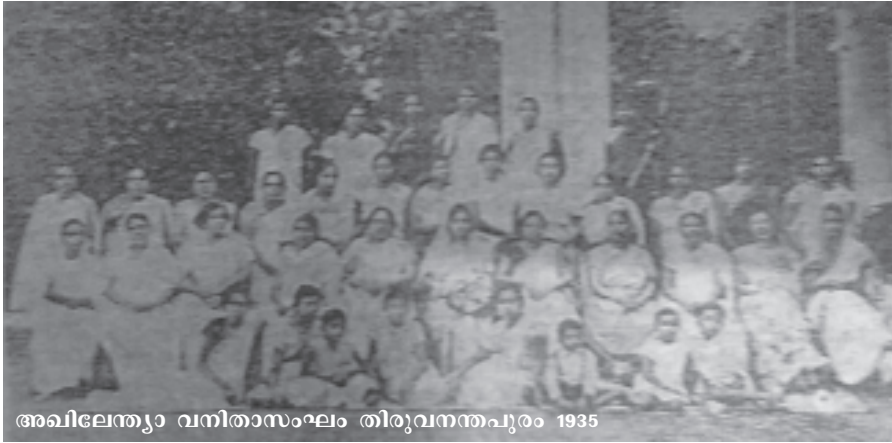
അഖിലേന്ത്യാ വനിതാസംഘം തിരുവനന്തപുരം 1935