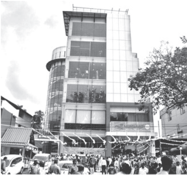
കോഴിക്കോട് കുടുംബശ്രീ മാൾ

അതിജീവനത്തിന്റെ മുന്നേറ്റങ്ങൾക്ക് കരുത്തുപകരാൻ ഏറ്റവും അനിവാര്യമായ സാമ്പത്തിക പിന്തുണ നൽകി സ്ത്രീകളെ ശാക്തീകരിക്കാൻ കുടുംബശ്രീ പദ്ധതിക്ക് കഴിഞ്ഞു. ഓരത്തേക്ക് മാറ്റി നിർത്തിയ സമൂഹത്തിനു മുന്നിൽ തന്റേടത്തോടെ ജീവിച്ചുകാണിക്കാനും താൻപോരിമയോടെ ഇടപെടാനും അവളെ പ്രാപ്തയാക്കിയത് ജോലിയും അതിൽ നിന്ന് ലഭിക്കുന്ന വരുമാനവുമാണ്. കാലങ്ങളായി അനുഭവിച്ചുവന്ന നീതി നിഷേധത്തിന്റേയും അടിച്ചമർത്തലിന്റേയും കല്പനകളെ ധിക്കരിച്ച്, പൊതു മണ്ഡലത്തിലേക്കിറങ്ങി അദ്ധ്യാനിച്ച് സ്വാഭിമാനം ഉയർത്തിപ്പിടിക്കാൻ ഈ പ്രസ്ഥാനം സ്ത്രീകളെ പ്രാപ്തരാക്കി. പെണ്ണിന്റെ ഒത്തൊരുമയുടെ വിജയമാണ് കുടുംബശ്രീ.