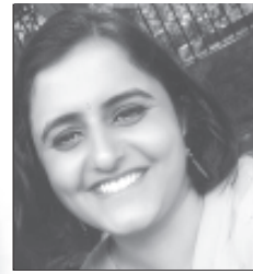
ധന്യ ആരോഗ്യമേഖലയിൽ ഭിഷഗ്വരയായി ജോലി ചെയ്യുന്നു