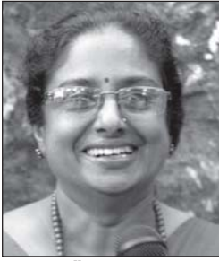
എസ്. കെ. മിതി.