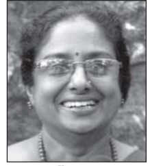
എസ്. കെ മിതി.