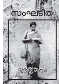
കവർ ചിത്രം കടപ്പാട്:

കെ.എൽ.കമ്മത്തിന്റെ 'പോസ്റ്റ് വുമൺ ഇൻ ബെംഗ്ലൂർ' എന്ന ഫോട്ടോ.