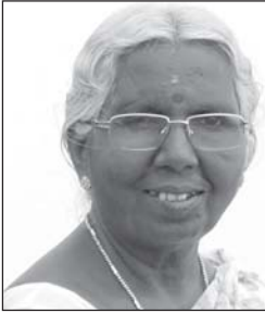
സി. എച്ച്. ഉഷാ കരുൺ