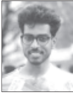
അക്കു അവിൽ കീഴറിഥം LGBTIQ കമ്മ്യൂണിറ്റി തിരുവനന്തപുരം

കുടുംബം എന്നുള്ള സാമൂഹിക നിർമ്മിതിയെ ചുറ്റിപ്പറ്റിമാത്രമാണ് നിലവിൽ വിവാഹം എന്നൊരു സമ്പ്രദായം നിലനിൽക്കുന്നത്. അതായത് അച്ഛനും അമ്മയും കുട്ടികളും അടങ്ങുന്ന ഹെറ്ററോനോർമിറ്റീവ് കുടുംബങ്ങൾ മാത്രമേ സമൂഹത്തിന്റെ മുൻപിൽ ഇന്നും സാധാരണമായുള്ളൂ.