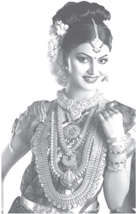
പരസ്യഹോർഡിങ്ങുകളിലെ സ്ഥിരം വധുക്കാഴ്ച

കേരളത്തിന്റെ ദൃശ്യമണ്ഡലത്തെ നിർണ്ണയിക്കുന്ന ഏറ്റവും ശക്തിമത്തായ ഒരൊറ്റ ദൃശ്യം എന്നൊന്നുണ്ടെങ്കിൽ അത് സർവാഭരണ വിഭൂഷിതയായി വഴിയരികിൽ പരസ്യഹോർഡിങ്ങിൽ നിൽക്കുന്ന വധുവിന്റേതാണ്. കേരളത്തിലെ ദേശീയ പാതയിലൂടെ യാത്ര ചെയ്യുന്ന ഏതൊരാളും ഒരു മണിക്കൂറിൽ ഏതാണ്ട് അമ്പതിലധികം വധുചിത്രങ്ങൾ പിന്നിടും. പ്രൈം ടൈമിൽ ടെലിവിഷൻ കാണുന്ന ഒരാൾ ഏഴുമിനിറ്റിൽ ഒരു വധുദൃശ്യം കാണേണ്ടി വരും. സർവാഭരണ വിഭൂഷിതകളായി, നേരെ നോക്കി പുഞ്ചിരിച്ചോ, അകലേക്ക് നോക്കി ആലസ്യത്തിലാണോ നിൽക്കുന്ന വധു, ഒഴുകുന്ന പുഴ, മേഘം മുടിയ പർവതം, ആകാശച്ചെരുവിലെ വാനവില്ല് ഇങ്ങനെ അതിസുന്ദരമായ പ്രകൃതി ചിത്രങ്ങളുടെ നടുവിൽ ഒരു സംഭ്രമവും ഇല്ലാതെ നിൽക്കുന്ന വധു. ഈ വധുവിന്റെ അതി ദൃശ്യത എങ്ങനെയാണ് മനസിലാക്കേണ്ടത്?