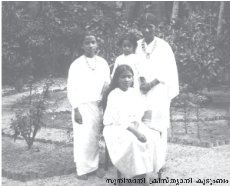
സുനിയതി ക്രിസ്ത്യാനി കുടുംബം

അവർക്കതു ദഹിക്കാനേ പറ്റിയില്ല. ഇത്തരം പിന്തുടർച്ച വടക്കുകിഴക്കൻ ഇന്ത്യയിലും ഉണ്ടെന്ന് ഞാൻ അവരോടു പറഞ്ഞു.