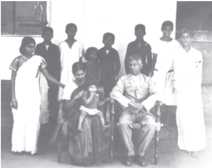
വടക്കൻ മലബാറിൽ നിന്നുള്ള പഴയൊരു കുടുംബചിത്രം

തിരുവനന്തപുരം ജില്ലകളിൽ സർവസാധാരണമായിരുന്നു. 1930 കളിൽ വരെ ജനിച്ച പലർക്കും കുടുംബത്തിൽ 'ഒന്നിലധികം അച്ഛന്മാർ' ഉണ്ടായിരുന്നു. പലപ്പോഴും ഇത് സഹോദരന്മാർ തന്നെ ആയിരുന്നു. മുത്ത സഹോദരൻ കല്യാണം കഴിക്കുകയും ആ സ്ത്രീയെ മറ്റ് ഇളയ സഹോദരന്മാർ കൂടി പത്നി ആക്കുകയും ചെയ്യുന്നതാണ് ഒരു രീതി. സ്നേഹരാഹിത്യമൊന്നും ഈ കുടുംബങ്ങളിൽ പറഞ്ഞു കേട്ടിട്ടില്ല.