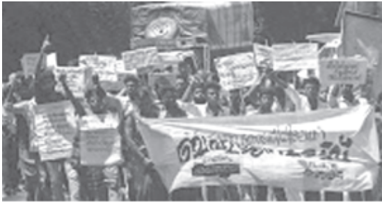
പോക്സോ നിയമത്തിന്റെ മറവിൽ ആദിവാസികളെ ജയിലിലടയ്ക്കുന്നതിനെതിരെ കൽപ്പറ്റയിൽ നടന്ന പ്രക്ഷോഭം

ഇരുപതാം നൂറ്റാണ്ടിന്റെ ആദ്യ പകുതിയിൽ ഇന്ത്യയിൽ ഏകീകൃതസ്വഭാവത്തോടെ വിവാഹസമ്പ്രദായങ്ങൾ ചിട്ടപ്പെടുത്തുകയുണ്ടായി. നാനാജാതിമതസ്ഥരും ഈ 'ആധുനികീകരണ' പ്രക്രിയയിൽ പങ്കാളികളാകേണ്ടിയും വന്നു. അധിനിവേശത്തിന്റെയും മുതലാളിത്തത്തിന്റെയും പരിസരങ്ങളിൽ ഏക ഭാര്യ/ഭർതൃബന്ധത്തിൽ അധിഷ്ഠിതമായ അണുകൂടുംബമാതൃക മാനകമായി സ്ഥാപിക്കപ്പെടുകയാണുണ്ടായത്. കേവലമായ നിയമനിർമ്മാണത്തിലൂടെ നടപ്പിലാക്കിയെടുത്ത ഈ സാമൂഹ്യമാറ്റം കേരളത്തിന്റെ ലിംഗഭേദവിന്യാസങ്ങളിൽ കാതലായ പൊളിച്ചെഴുത്തുകൾ സൃഷ്ടിച്ചു എന്നു മാത്രമല്ല പുരുഷാധികാരത്തിന് പുതുരൂപത്തിൽ വേരോടാനുള്ള വളക്കൂറുള്ള മണ്ണൊരുക്കുകയും ചെയ്തു. കുടുംബത്തിനകത്ത് ഭർത്താവ് എന്ന അധികാരിയെ സ്ഥാപിക്കുകയും ഔദ്യോഗിക രേഖകളിൽ പുരുഷനെ മാത്രം കുടുംബനാഥനായി പരിഗണിക്കുകയും ചെയ്യുന്ന വ്യവസ്ഥയ്ക്കും ഇത് വഴിയൊരുക്കി.