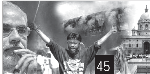
ആഗോളവൽകരണകാലത്തെ ചില പ്രാദേശിക തൊഴിൽ ചിത്രങ്ങൾ - നീതി.പി.