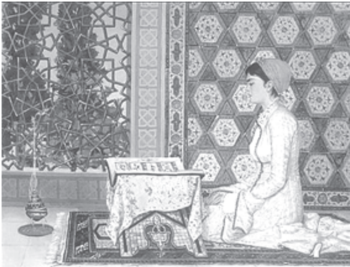
1880 ഓട്ടോമാൻ ടർക്കിയിൽ രചിക്കപ്പെട്ട 'വുമൻ റീഡിങ്ങ് ബുക്'

ജംഇയ്യത്തുൽ ഉലമ തുടങ്ങിയ ഫ്രാക്ഷനുകളിലും അതിന്റെ പോഷകഘടകങ്ങളായ യുവജനസംഘടനകളിലും വിദ്യാർത്ഥി സംഘടനകളിലും ഒന്നും തന്നെ സ്ത്രീകൾ ഇല്ല. സ്ത്രീകൾ പൊതുരംഗത്തു പ്രവർത്തിക്കുന്നത് അങ്ങേയറ്റം എതിർക്കുന്നുണ്ടെങ്കിലും ഇവർ വനിതാകോളേജുകൾ നടത്തുന്നുണ്ട്. ആദ്യകാലത്ത് സ്ത്രീ വിദ്യാഭ്യാസത്തോട് മുഖം തിരിഞ്ഞു നിന്നെങ്കിലും കാലം മാറിയതോടെ പെണ്ണുങ്ങൾ വേണേൽ പഠിക്കാൻ പോവട്ടെ എന്ന നിലപാട് ഇവർ സ്വീകരിച്ചു. വിദ്യാഭ്യാസം കച്ചവടമായ കാലത്ത്, ആ ഒഴുക്കിനൊപ്പം നീങ്ങാനും സ്ത്രീകൾക്കായുള്ള വിദ്യാഭ്യാസ സ്ഥാപനങ്ങൾ നടത്താനും ഇവർ തയ്യാറായിട്ടുണ്ട്. പള്ളികളിൽ സ്ത്രീകൾക്ക് പ്രവേശനം നൽകുന്നത് എതിർക്കുന്ന ഇവർ ആകെ അതിന് അനു മതി നൽകാറുള്ളത് ആരാധനാലയങ്ങളുടെ നിർമ്മാണവും പുനരുദ്ധാന പ്രവർത്തനങ്ങളും മറ്റുമായി ബന്ധപ്പെട്ട ധനസമാഹാരണത്തിന് സാധാരണ നടത്താറുള്ള പള്ളി 'വീരുന്നുകളുടെ' കാര്യത്തിലാണ്.