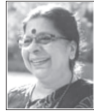
ഗീത സ്ത്രീവാദ പ്രവർത്തക, എഴുത്തുകാരി