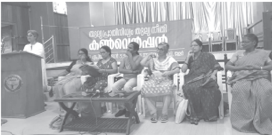
2014-ൽ തൃശൂരിൽ നടന്ന തുല്യപ്രാതിനിധ്യം തുല്യനീതി കൺവെൻഷൻ

യൻ തുടർച്ചയായി രണ്ടു വർഷങ്ങളിൽ ഏറ്റവും മികച്ച പഞ്ചായത്ത് പ്രസിഡന്റായി തെരഞ്ഞെടുക്കപ്പെട്ടിരുന്നു. ആദിവാസി വിഭാഗത്തിൽ പെട്ട സ്ത്രീയാണെന്നത് അവരുടെ വിജയത്തിന്റെ തിളക്കം വർദ്ധിപ്പിക്കുന്നു. 2018ലെ മഹാപ്രളയത്തിൽ കേരളത്തിലെ തദ്ദേശ സ്ഥാപനങ്ങളിലെ സ്ത്രീ പ്രതിനിധികൾ പുരുഷന്മാരോടൊപ്പം നിന്നു പ്രവർത്തിച്ചതും നാം കണ്ടതാണ്. അവരിൽ വലിയൊരു ശതമാനം സംവരണ മണ്ഡലങ്ങളിൽ നിന്നു മത്സരിച്ചുവരായിരുന്നു. സംവരണം അവരുടെ കാര്യശേഷിയെ പുറത്തു കൊണ്ടുവരാൻ സഹായിച്ചു എന്നതാണ് സത്യം. കേരളമടക്കം പല സംസ്ഥാനങ്ങളിലും 50 ശതമാനം സ്ത്രീ സംവരണം നിലവിലുണ്ട്. മറ്റു സംസ്ഥാനങ്ങളിൽ മൂന്നിലൊന്നും. സംവരണം ഇല്ലാതിരുന്നെങ്കിൽ തദ്ദേശ സ്ഥാപനങ്ങളിലെ 10 ലക്ഷം വരുന്ന സ്ത്രീ പ്രതിനിധികളിൽ മിക്കവരും പൊതുരംഗത്തുണ്ടാകുമായിരുന്നില്ല.