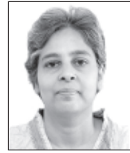
കെ.എം. രമ സ്ത്രീവാദ പ്രവർത്തക