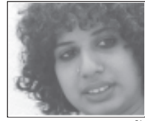
ജെന്നി എസ്. ഗവേഷക