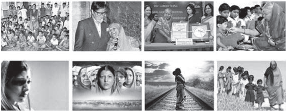
മീ സിന്ധുതായ് സപ്കാൾ എന്ന മറാഠി സിനിമയിലെ രംഗം

“എപ്പോൾ വേണമെങ്കിലും എനിക്ക് മരിക്കാമായിരുന്നു. ഞാൻ മരിക്കണമായിരുന്നു. ജീവിക്കാനുള്ളതിനേക്കാൾ എത്രയോ എത്രയോ കാരണങ്ങൾ മരിക്കാനാണ് ഉണ്ടായിരുന്നത്. പക്ഷേ, ജീവിക്കുന്നത് മരിക്കുന്നതിനേക്കാൾ വിഷമമാണെന്ന് തോന്നിയതുകൊണ്ടാവാം ഞാൻ ജീവിക്കാൻ തീരുമാനിക്കുകയാണുണ്ടായത്. തോൽക്കാൻ വയ്യ എന്നു തോന്നി.