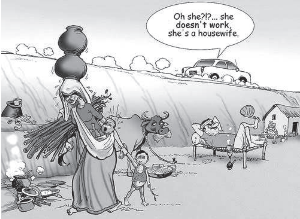
അവളോ? അവൾക്കു പണിയൊന്നുമില്ല. അവൾ വീട്ടമ്മയാണ്...!

ലക്കര നേരിയതും നെറ്റിയിൽ ഊക്കനൊരു സിന്ദൂരപ്പൊട്ടും അത്യാവശ്യമെന്ന ചേരുവ ദഹിക്കാതെ കിടക്കുന്നു. നായികയ്ക്കൊരു ബുള്ളറ്റും കഥയിലൊരു സാവർഗ്ഗപ്രേമവും extra marital affair ഉം ഗുണ്ടാ സെറ്റപ്പും ഉണ്ടെങ്കിൽ ഭേഷായി എന്ന രുചിക്കുട്ടിലേക്ക് ലാൽ ജോസും ചുരുങ്ങി. നളിനിയുടെ ആവശ്യത്തിലേറെയുള്ള വെളുപ്പും തെരുവ് സൗഹൃത്തിന്റെ അസാമാന്യകുപ്പും കരിയായിലെന്ന വിളിപ്പേരും നീനയുടെ വെളുപ്പ് കലർന്ന തവിട്ടും ക്ഷീണിച്ച തലമുടിയും വർണ്ണവർഗ്ഗാധിക്ഷേപങ്ങളിലേക്ക് ഒരു പരിധിവരെ നീങ്ങുന്നുണ്ട്. ഇരുപത്തിയൊന്നാം നൂറ്റാണ്ടിലും സ്ത്രീയുടെ സ്വതഃപ്രഖ്യാപനങ്ങൾ കള്ളുകുടിയും പുകവലിയുമാണെന്ന് ധരിച്ചവരായ സംവിധായകനും തിരക്കഥാകൃത്തുമാണ് മലയാളസിനിമയ്ക്കുള്ളത്. കഷ്ടം!