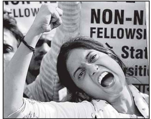
ഒക്യുപയ് യൂജിസി: വിപണിയാധിഷ്ഠിത വിദ്യാഭ്യാസനയങ്ങൾക്കെതിരെ പ്രതിരോധം - അപരാജിത രാജ

എഡിറ്റർ : ഡോ. ഷീബ കെ.എം. മാനേജിംഗ് എഡിറ്റർ : കെ. അജിത എക്സി.എഡിറ്റർ : ഡോ. ജാൻസി ജോസ്, പത്രാധിപ സമിതി : ശിരിജ പി. പാതേക്കര, ജ്യോതി നാരായണൻ, ഡോ. മിനി പ്രസാദ്, ഡോ. പി. ഗീത, ഡോ.ഖദീജ മുഹ്താസ്, ഡോ. സുനീത ടി.വി., അഡ്വ.കെ.കെ.പ്രീത, ഷീബാ ദിവാകരൻ, ഡോ. ഷംഷാദ് ഹുസൈൻ, കുസുമം ജോസഫ്, സുൽഫത്ത് സർക്കുലേഷൻ മാനേജർ : ചാരുലത എ.എസ്. ഉപദേശകസമിതി : സുഗതകുമാരി, പ്രൊഫ. എം. ലീലാവതി, ഡോ. ശാരദാമണി, ഡോ. മല്ലികാസാരായ്, ഡോ. ബീനാപോൾ ലേഔട്ട് & കവർ : സുവിജ വെബ്സൈറ്റ് : വസന്ത പി. പ്രിന്റിംഗ് : ഏ- വൺ ഓഫ്സെറ്റ് പ്രിന്റിംഗ്, 0495 2441934, 2442934